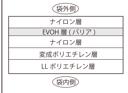
フィルム横からの断面図